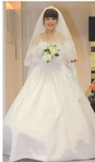
こくろハロウィン2014ファッションショー