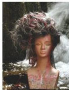
ユーカリジャパン 第8回 DESIGNERS AWARD 2013