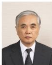
九州産業福祉大学 東京薬短期大学 学長