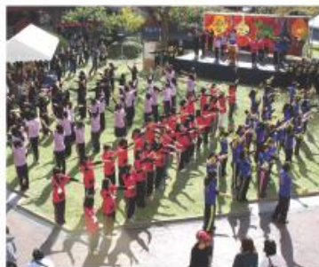
毎年恒例の九州栄養福祉大学・東筑紫短期大学大学祭は「劇〜今こそ集え筑紫の「皿」〜」をテーマに開催されました。