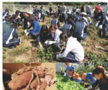
小倉南区キャンパス農園で行なわれ、木学1年生と附属幼稚園の年中さんが一緒に芋掘り、夏野菜の収穫、にんにくの苗植えを約300人で行いました。